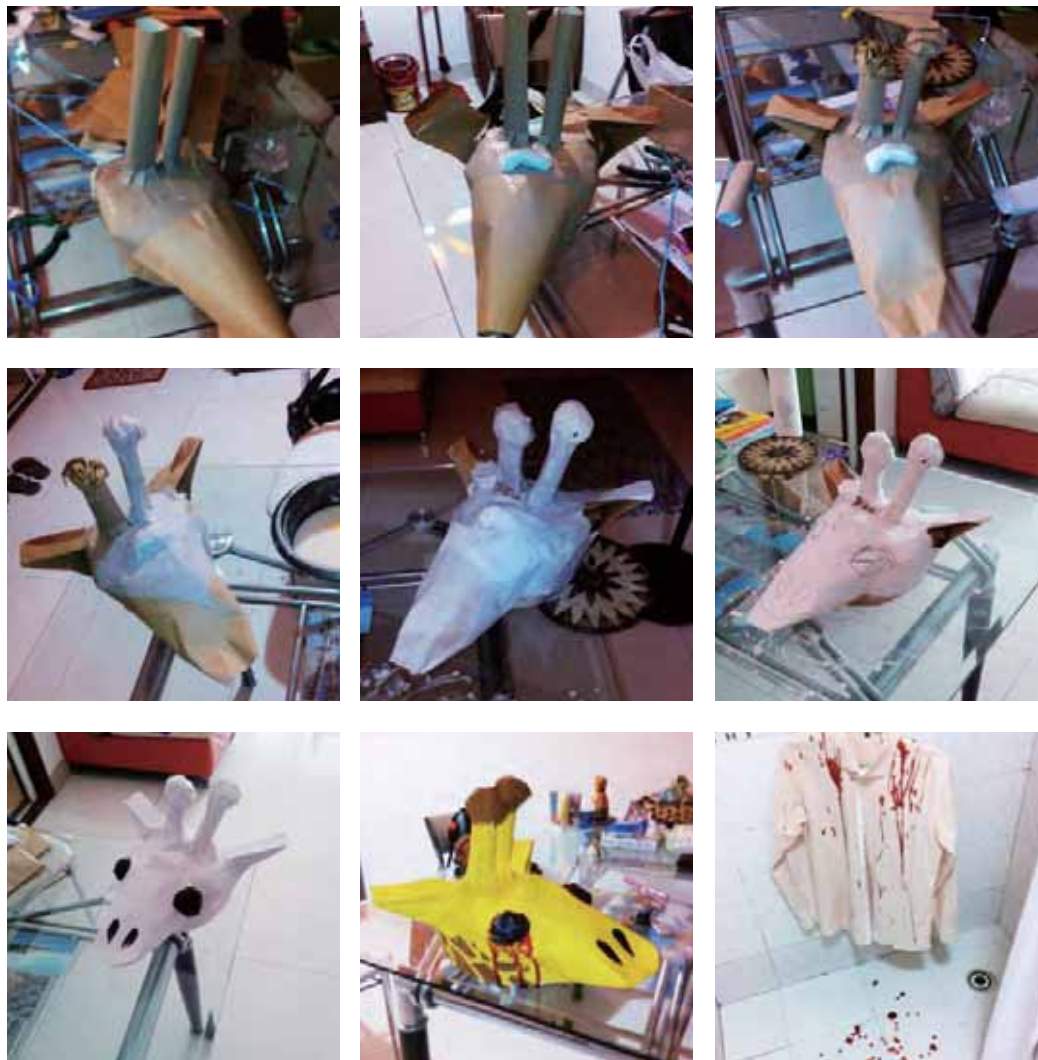
▀ The process of making his amazing costume